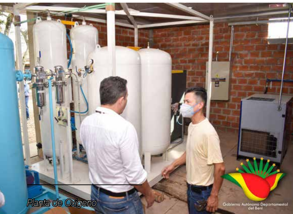
Planta de Oxígeno

el Hospital German Busch, que ayudó a salvar vidas y devolvió la certidumbre a la gente. De otro lado, las donaciones tramitadas ante la cooperación internacional están por buen camino, se ha concretado la donación de rayos x portátiles y la