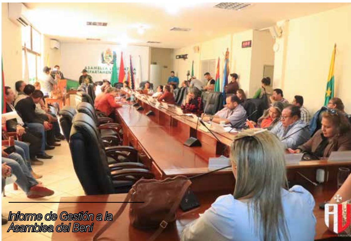
Informe de Gestión a la Asamblea del Beni

Respecto al área administrativa y financiera al iniciar la gestión, constaté a través de informes técnicos que la