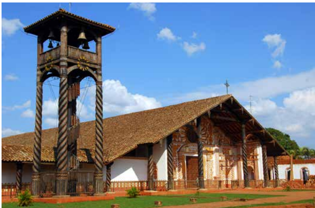
Iglesia Jesuitica de Concepción