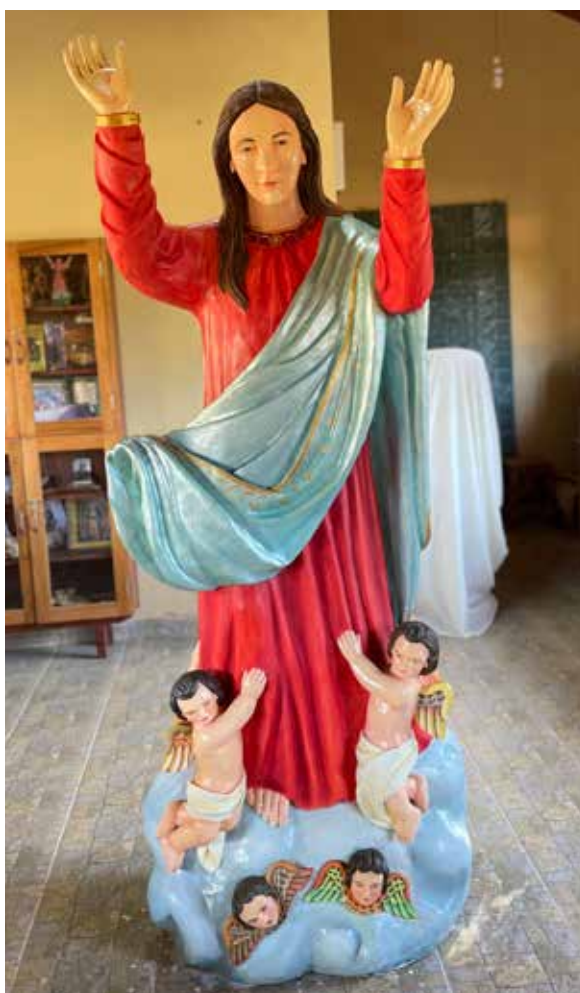
Iglesia de San Miguel de Velasco

Cuarteto Ximenez, de Canadá, tocó de forma encantadora y embelesó el cuerpo y el alma de los presentes. Al día siguiente teníamos que volver a Santa Cruz. En cierto sentido, nuestro viaje a la magia del festival murió ese día. En el viaje de vuelta, digerimos lo que habíamos vivido, una cierta melancolía se extendió por mi pecho. Los días pasaron volando. Pudimos experimentar y aprender mucho. Me sorprendió cómo un viaje ordinario se convirtió inmediatamente en una peregrinación mágica y espiritual. Todavía no sé si volveré a visitar el festival. Quién sabe dónde estaré dentro de dos años, quién sabe