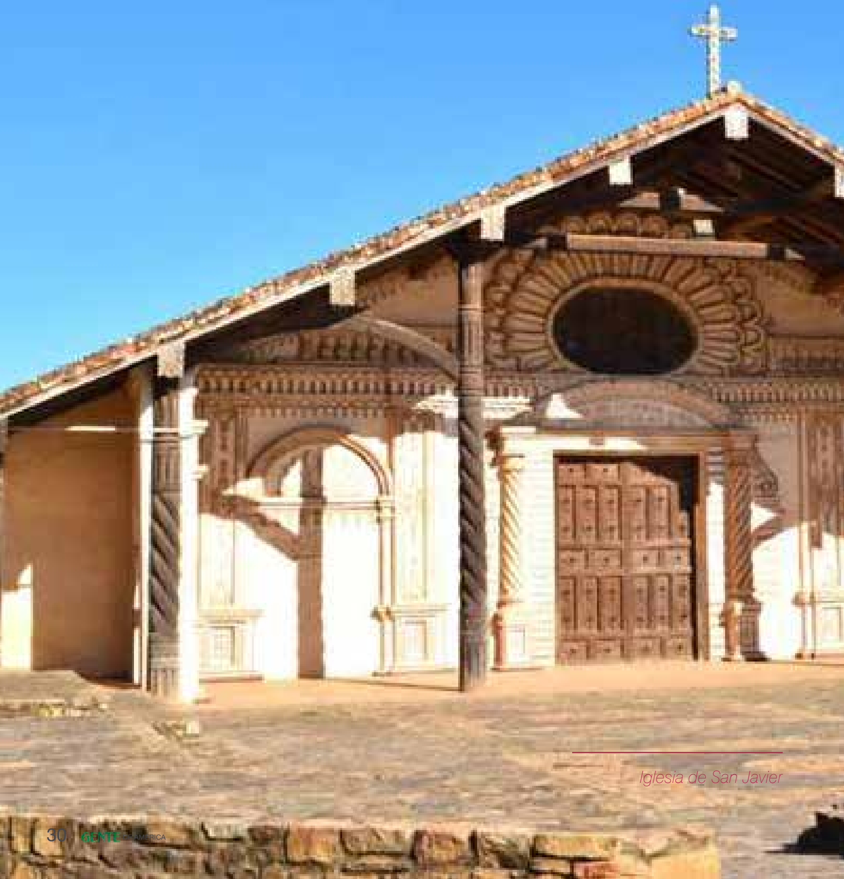
Iglesia de San Javier