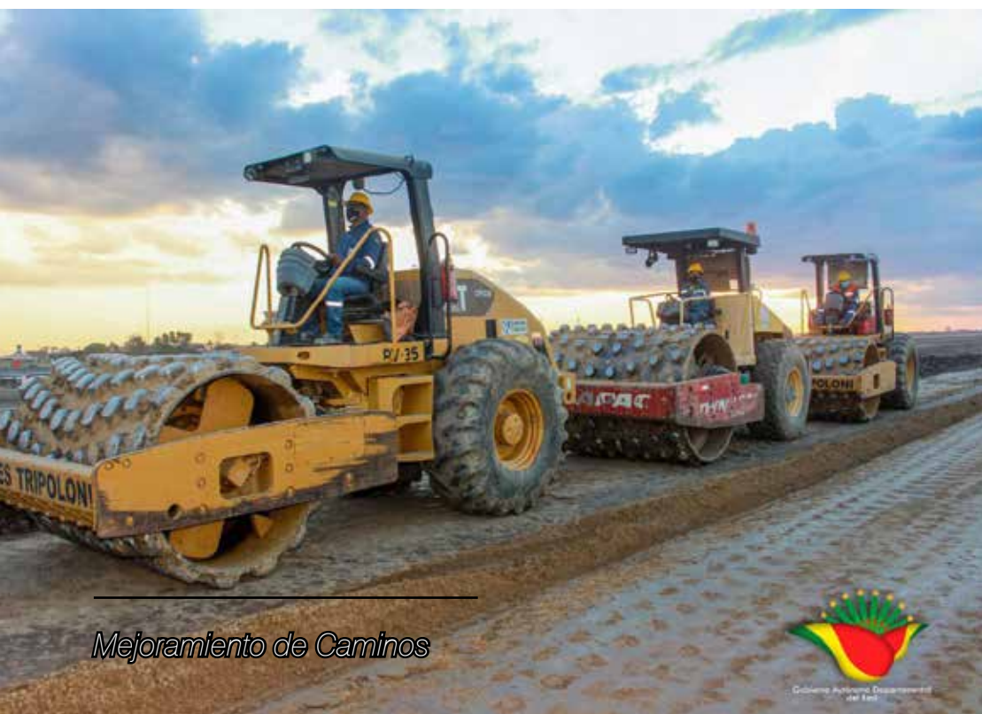
Mejoramiento de Caminos

las gestiones venideras. En esas condiciones, he decidido pasar de la administración tradicional de la cosa pública, a la gestión estratégica, aquella que optimiza la inversión de los escasos recursos en proyectos productivos, generando condiciones para atraer inversiones de la