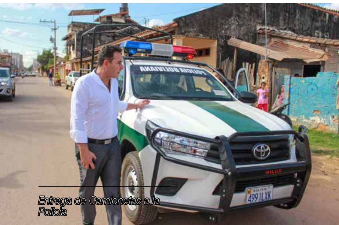
Entrega de Camionetas a la Policía

leyes departamentales que fueron promulgadas y no reglamentadas, dejándolas inefectivas por falta del citado requisito; en algunos casos