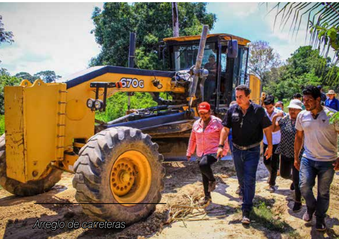
Arreglo de carreteras

4. Por iniciativa del Órgano Ejecutivo, se dio inicio al proceso de transferencia de los terrenos urbanos de CABOBE en el Municipio de Reyes. Después del intercambio de notas entre los dos niveles de Gobierno, se conformó una comisión mixta que debe presentar una propuesta sobre el número de