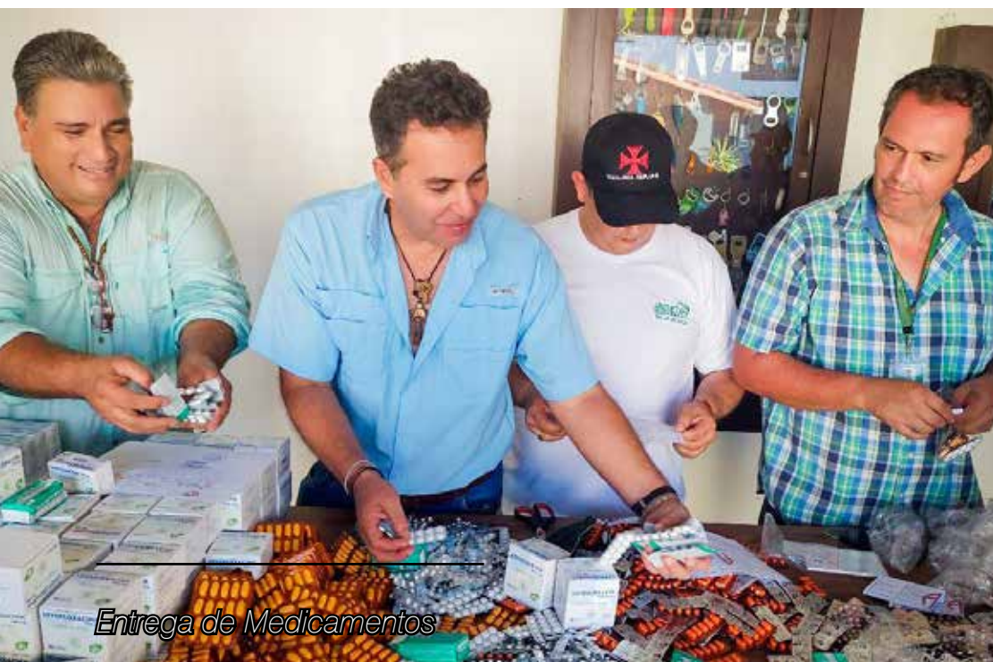
Entrega de Medicamentos