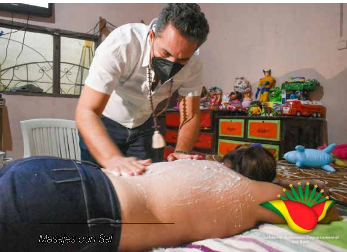
Masajes con Sal

Las provincias benianas son Cercado, Iténez, José Ballivián, Mamoré, Marbán, Moxos, Vaca Díez y Yacuma.