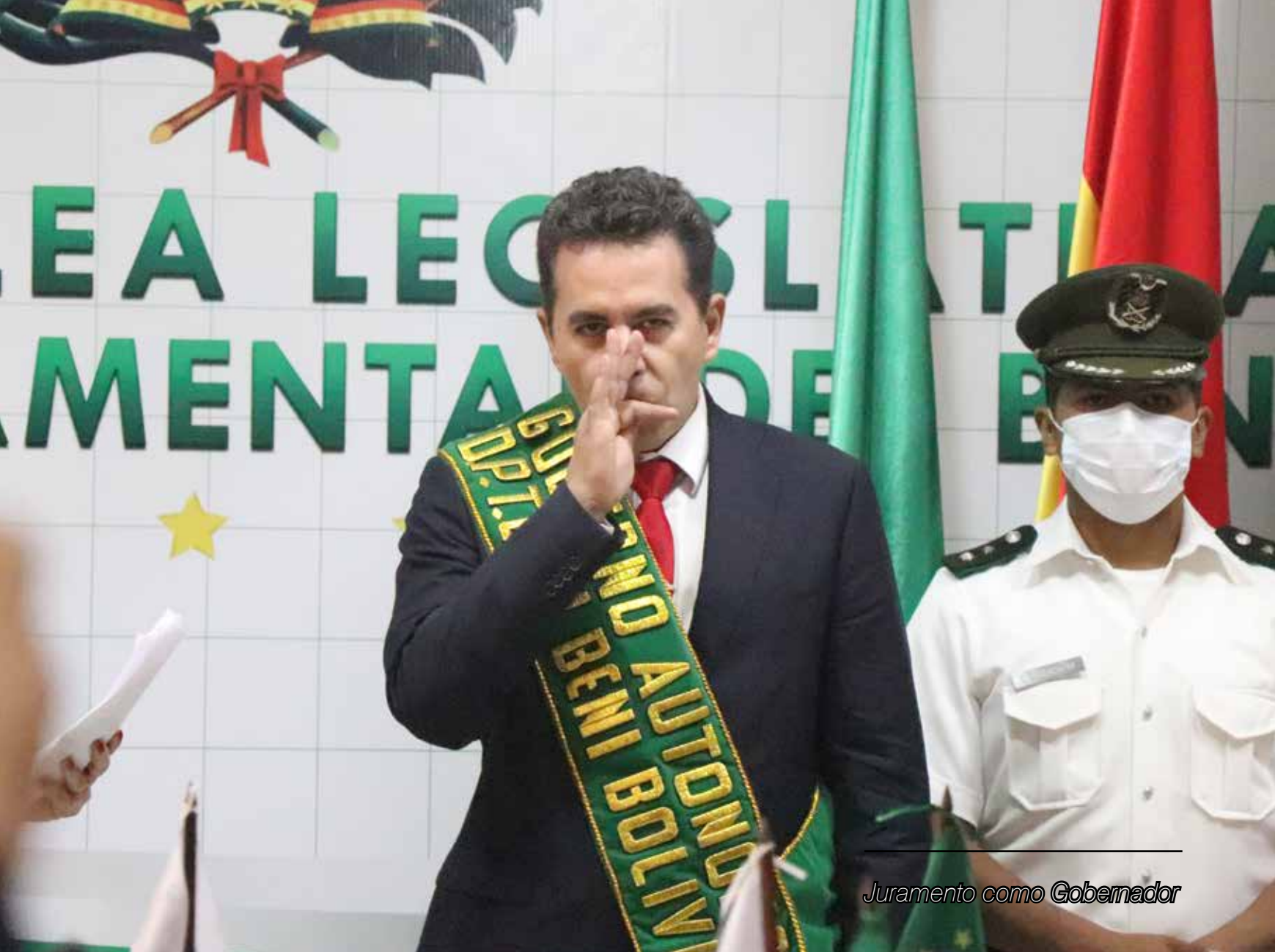
Juramento como Gobernador

Recibe el GALARDÓN GENTE DE AMÉRICA A LA VOCACIÓN DE SERVICIO, por su labor altruista, que le permitió ser premiado por Dios y ser elegido como la primera autoridad política de su Beni amado