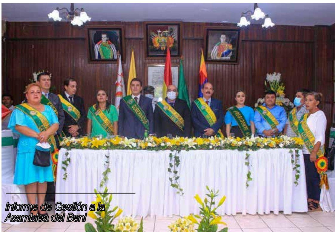
Informe de Gestión a la Asamblea del Beni

improvisación y el despilfarro de los recursos públicos habían corroído los cimientos de la institución, nunca imaginé que tanta corrupción, incapacidad y negligencia, pudiesen cohabitar en un mismo tiempo y espacio.