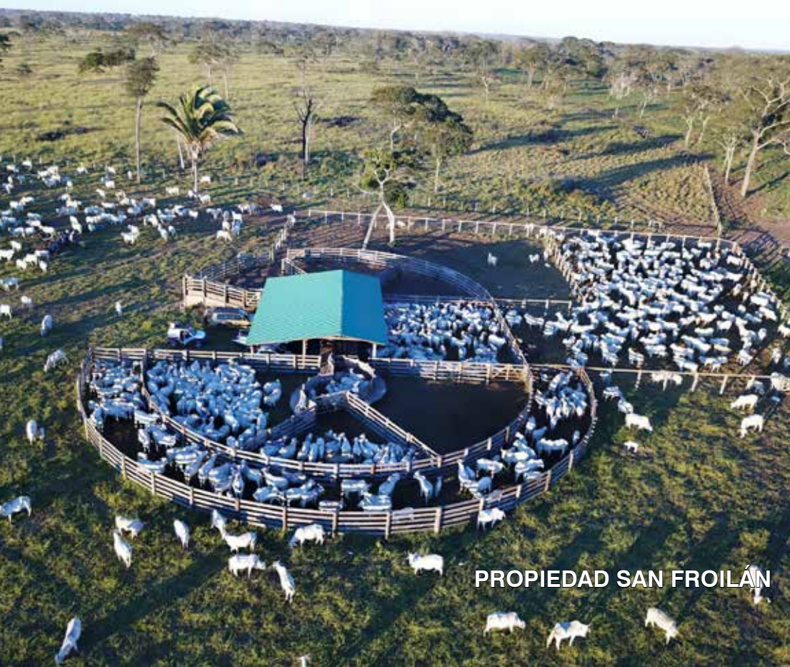
PROPIEDAD SAN FROILÁN