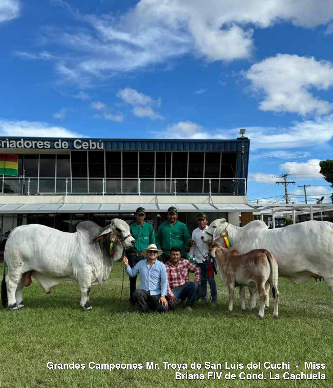
Grandes Campeones Mr. Troya de San Luis del Cuchi - Miss Briana FIV de Cond. La Cachuela