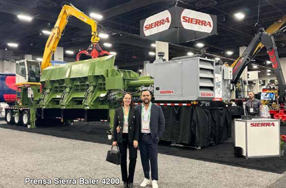
Prensa Sierra Baler 4200