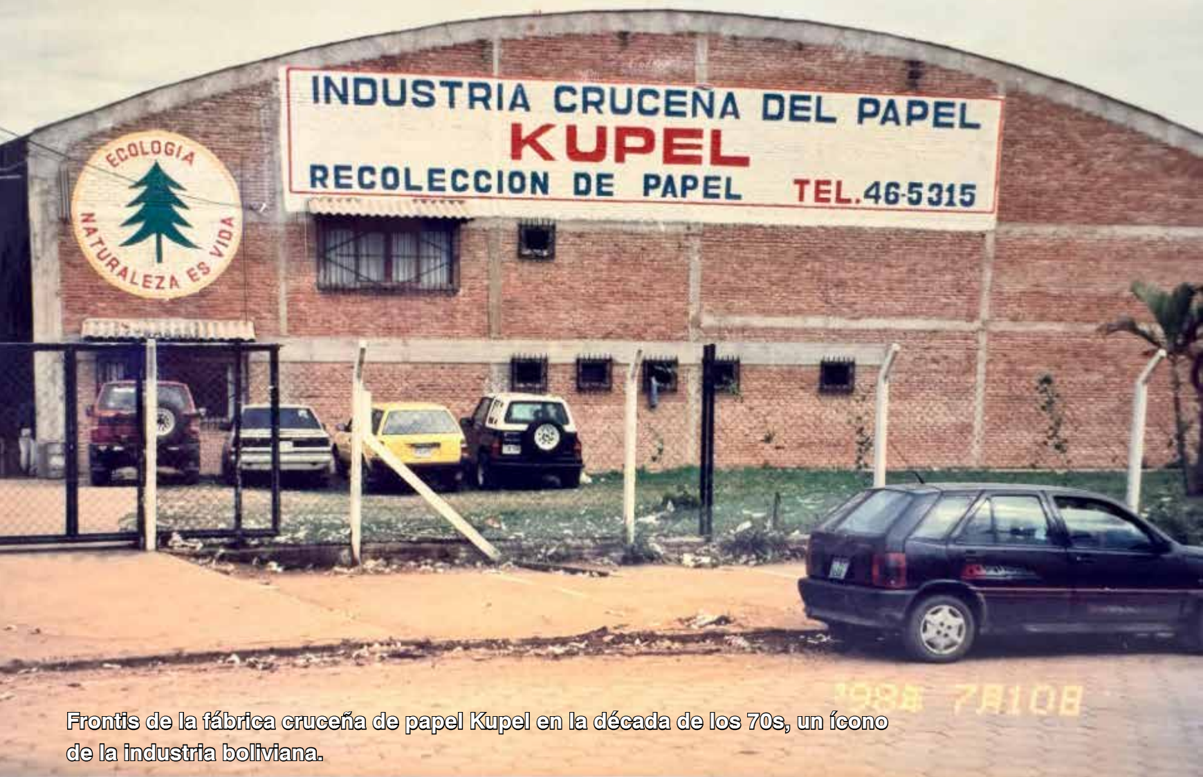
Frontis de la fábrica cruceña de papel Kupel en la década de los 70s, un ícono de la industria boliviana.

donde fortaleció su liderazgo natural. Fue nombrado tesorero de su curso, y se le recomendó la organización de fiestas y eventos, incluyendo el viaje de promoción. Bajo la supervisión de los hermanos salesianos, participó en la recaudación de fondos para obras sociales, incluyendo la construcción de una escuela, lo que reforzó su compromiso con el desarrollo comunitario y social, una característica que se vería reflejada en sus acciones futuras como empresario.