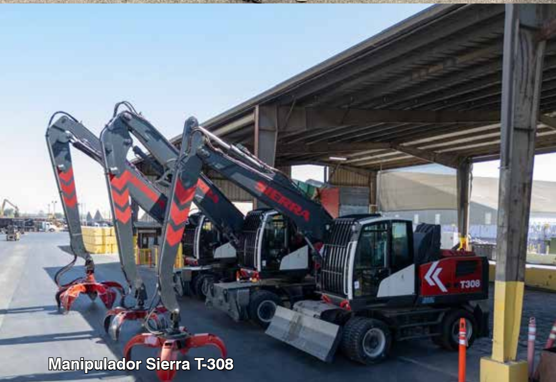
Manipulador Sierra T-308