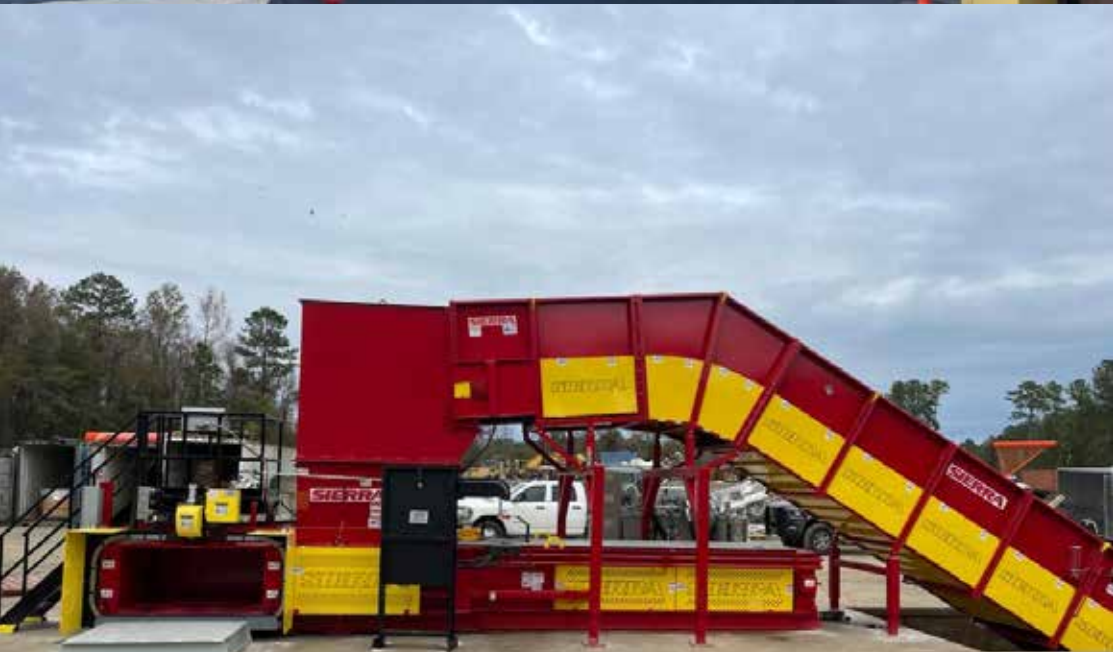
Prensa Sierra REB-1