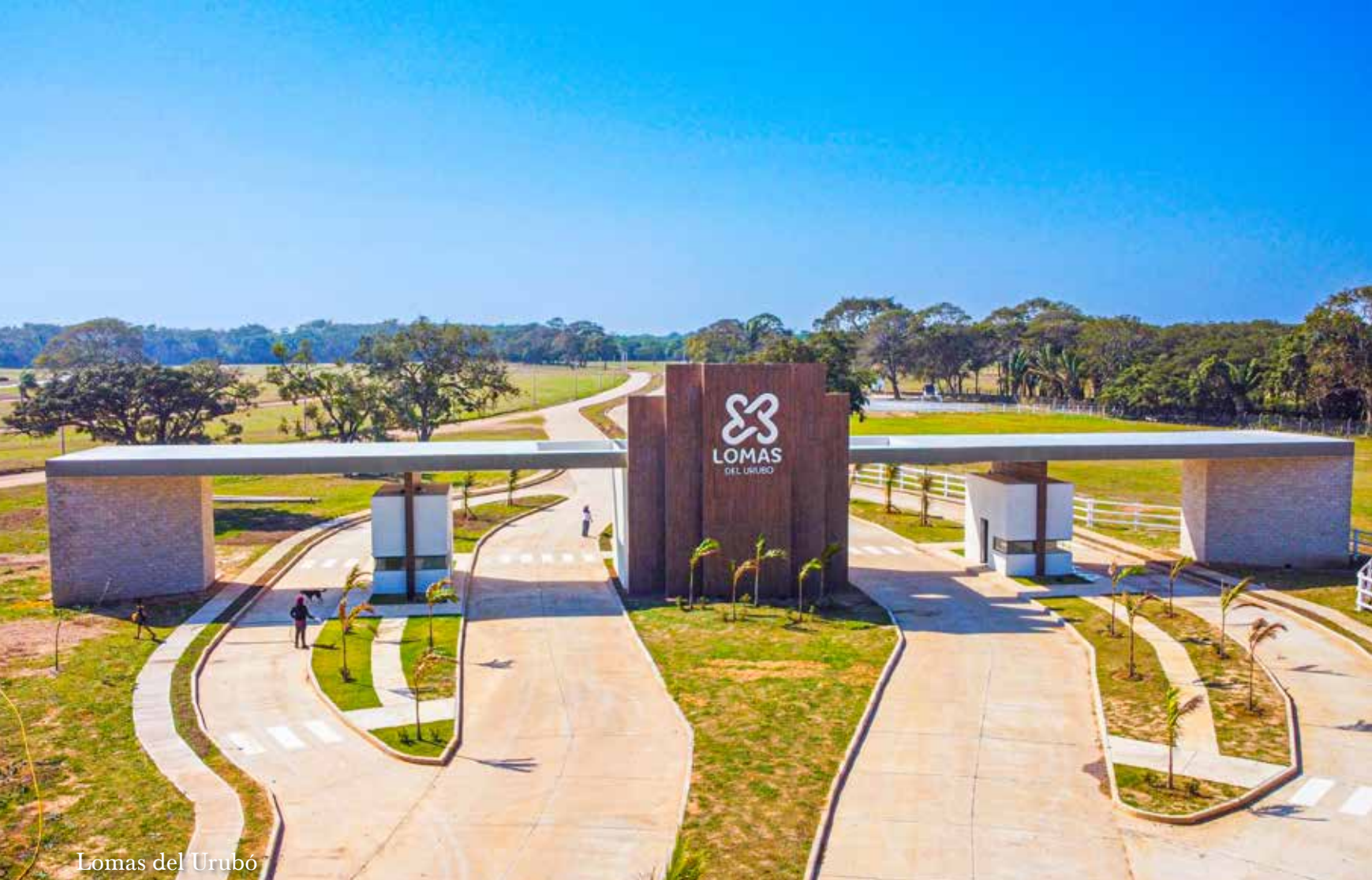
Lomas del Urubó

El empresario ha construido una empresa solvente, manejeable, estable, con liquidez y buena reputación