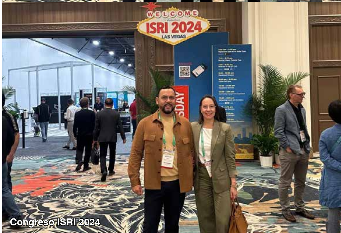
Congreso ISRI 2024